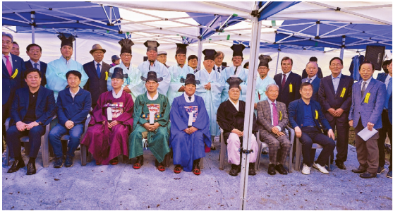
▲ 서울 도봉서원 춘계제향