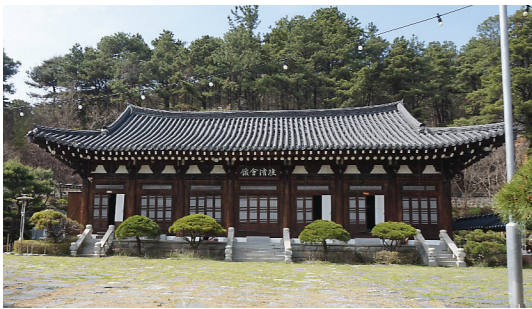
▲ 쌍청회관 전경

기와지붕의 물매가 기울어 가고 있고, 자요당(관리사)는 지붕이 새고 있으며, 쌍청당 산소 올라가는 길의 봉선문은 무너져서 새로 지었고, 출입하는 큰 문인 송덕문 오르는 계단은 층계석이 어그러져 가고 있습니다.