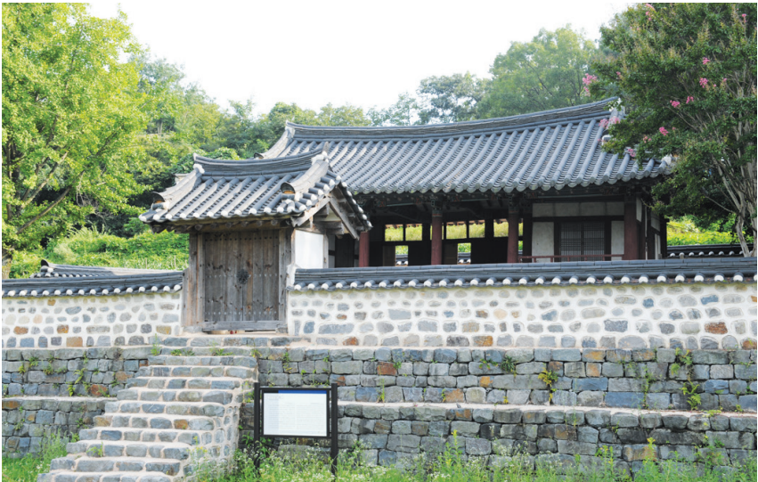
▲ 용강서원 전경