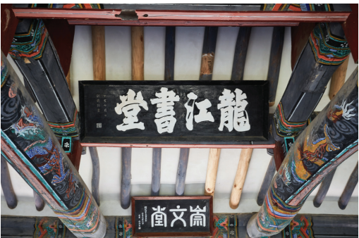
▲ 용강서원 현판

두고 양쪽은 좁은 공간으로 꾸몄다. 조선 시대에 서원의 확장을 막는다는 구실로 폐쇄되었지만, 광복 후 지방 유림의 정성으로 다시 복원하여 금산 지방에 남아 있는 유일한 서원이다.