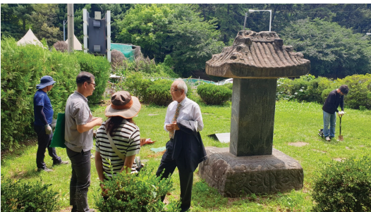
▲ 안내판설치 독려

비롯해 다양한 형태의 문양이 새겨져 있는 점과 신도비 후기를 비로 세운 사례가 많지 않다는 점에서 독특한 가치가 있는 문화유산이다.