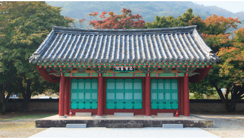
▲ 충현서원 사당

인 서기를 남강고사南康故事를 모방하여 別祀하기 시작하였다. 1652년(효종3)에 조헌을, 1674년(현종15)에 김장생을, 1686년(숙종12)에 송준길을, 1713 (숙종39)에 송시열을 추배하였고, 1712년(숙종38)에는 연천의 임장서원에서 주자의 화상을 모사해서 신판神板 뒤에 봉안하고 이를 기리기 위하여 최구서가 짓고 조상우가 쓰고 윤덕준이 전을 한 충현사원 사적비명忠賢書院 事績碑銘을 서원 뜰에 세웠다. 1871년(고종8) 서원 철폐령에 따라 훼손되었다가 1925년 사우를 중건하였고, 1969년에 사단법인이 결성되어 이사회를 통해서 운영되고 있으며, 1989년 강당이 중건되고 1994년 관리사가 건축되었다.