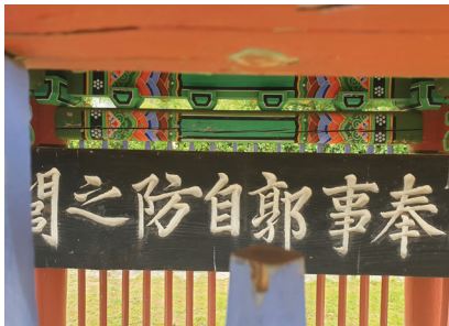
▲ 광자방 정려

또 다른 참고 문헌에서는 광자방은 송시열의 아버지 송갑조(宋甲祚)를 사위로 맞이하여 후에 선산 광씨의 각