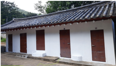
▲ 건물 전면 페인팅

지평공 재실은 매년 음력 10월 10일 지평공 세일사에 많은 종원들이 참석하여 세일사를 봉행하고 있다. 그동안 재실 화장실이 협소하고 설비가 노후되고 남녀 구분이 되어 있지 않아 여러 종원들이 이용하기 불편하였다.