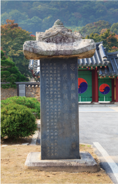
▲ 충현서원 사설 우암송선생 추향기

차례 올렸으나 국왕의 진노를 사 관직에서 물러나 옥천군 안읍 밤터로 돌아와 후율정사後栗精舍를 짓고 제자를 양성하였다. 1591년 일본의 풍신수길의 전소를 보내어 명나라를 칠 길을 빌리자고 하여 옥천에서 올라가 지부상소로 대궐문 앞에서 3일간 일본 사신 목 벨 것을 청하였으나 받아들여 지지 아니하여 1592년 4월 임진왜란이 일어나자 옥천에서 의병 1600여명을 모아 8월 1일 영규의 승군僧軍과 함께 청주성을 수복하였으나 충청도 순찰사 윤국형의 방해로 의병이 강제 해산 당하고 불과 700명 남은 병력을 이끌고 금산으로 행진 영규의 승군과 합진하여 전라도로 진격하려던 왜군 고바야기와 8월 18일 전투를 벌인 끝에 병력이 모두 전사하였다. 1604년 선무원종공신 1등으로 책록되고 1734년(영조10) 영의정에 추증되고, 1883년(고종20) 문묘에 배향되었고 표충사의 4개 서원에 제향되었으며 1971년 금산의 순절지 칠백의충이 성역화 되었다.