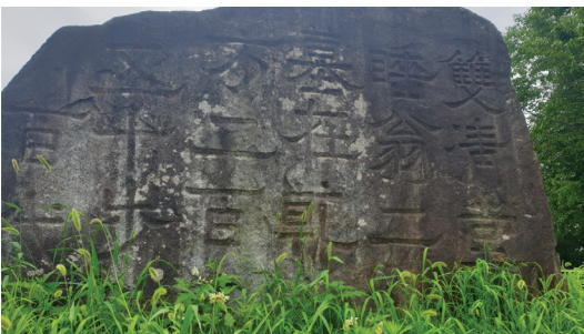
▲ 쌍청당 암각

이 글귀는 1687년에 김수증이 팔분체(八分體)로 썼다는 기록이 조선환여승람에 전하는데 김상헌의 손자인 김수증은 제월당 송규렴의 손위 처남으로 우암 송시열과도 깊은 교분은 나누었던 사이였으며, 팔분체에 능했던 인물이다.