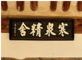
▲ 한천정사 현판

름 붙여진 그 모양이 기이하고 아름다운 곳이다. 후세에 우암선생의 제사를 모시고 글을 가르치는 한천서원이 세워졌다가 고종 5년(1868)에 철폐된 후 유림들이 1910년 한천정사(寒泉精舍)를 건립하여 현재에 이르고 있다.