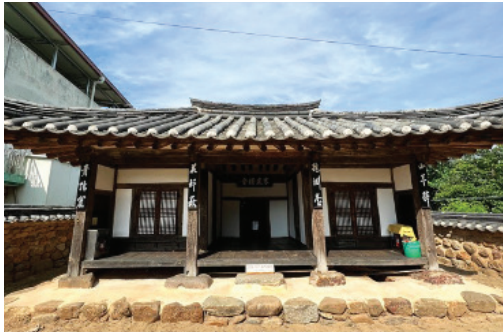
▲ 한천정사 전경

앞면 3칸·옆면 2칸 규모로, 지붕은 옆면에서 볼 때 여덟 팔(八)자 모양인 팔작지붕이다. 중앙에 대청마루가 있고 양쪽 끝에 온돌방을 두었다. 주변에 담장을 두르고 앞면에 문을 두었는데 앞면 양측에 은행나무가 있다. 이 건물은 건축양식에서 옛 기법이