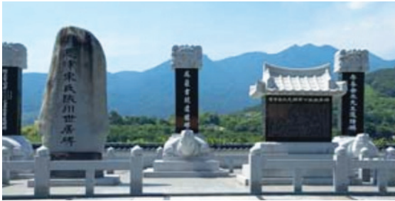
▲ 봉암서원 유허비 및 세거비 등