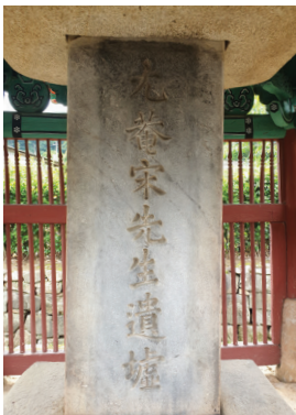
▲ 우암 송시열 유허비

그곳에서 의병장 신간수(申簡秀)·장덕개(張德蓋) 등과 승장(僧將) 영규(靈圭)가 이끄는 3,800여명의 군사와 더불어 왜군과 싸워 청주성을 탈환하는데 크게 활약, 전공을 세웠으나, 금산성전투(錦山城戰鬪)에서 조헌과 함께 전사하였다. 참고문헌 『선조실록(宣祖實錄)』, 『송자대전(宋子大全)』