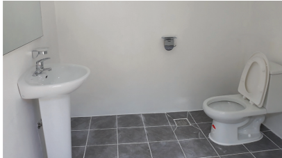
▲ 남자 화장실

장실(세면대, 양변기, 소변기 구분 설치)을 현대식으로 만들었다. 대종회에 서는 앞으로도 대종회 소유의 건물과 재실 등의 설비가 노후되어 종원들의 이용이 불편한 시설에 대하여는 연차적으로 보수를 실시하여 각종 행사나 세일사 등에 참석하시는 종원들께서 이용에 불편하지 않도록 최선을 다하고자 한다.