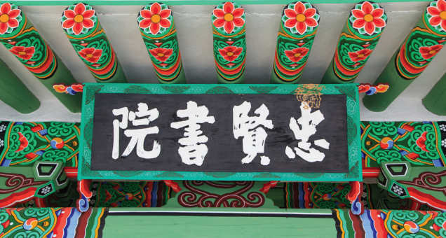
▲ 충현서원 현판