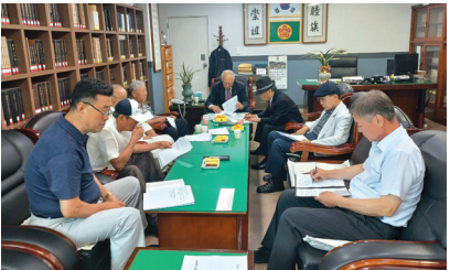
▲ 고문 및 임원회의

제14회 대전 “효”문화 뿌리축제 참여여부에 대하여 고문 임원들과 고견을 나누고 임원, 고문, 종원 모두의 건강을 기원하였다.