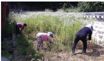
▲ 지평공재실 예초작업