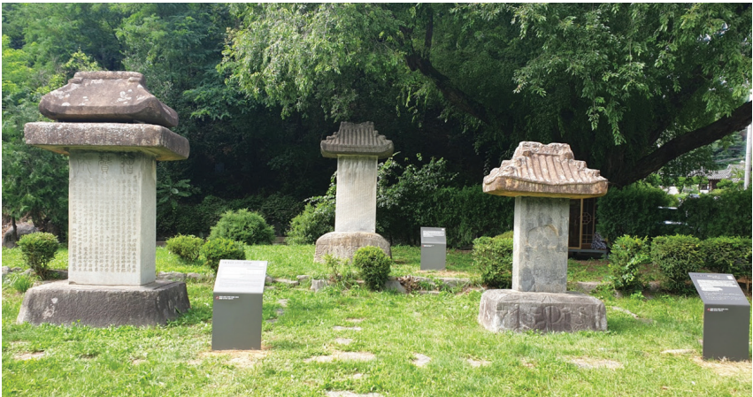
▲ 신도비와 안내판

유와 자신의 아버지 송갑조를 위해 김수증에게 부탁하여 글자를 새겼다는 이야기가 담긴 지명각석으로 예술적, 역사적 가치가 있는 문화유산이다.