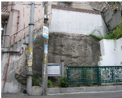
▲ 연립주택의 축대가 된 현재의 바위벽