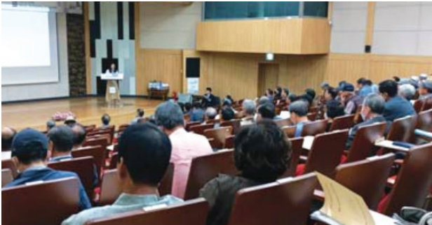
▲ 학술대회 광경

쌍청당 송유(宋儷)의 현손 충순위공 송세적(世勳)(1481.09.13.~미상)은 통례원 찬의 광계(光啓)의 따님과 혼인하여 삼가현 병목(지금의 합천군 대병면)에 정착하게 되었다. 남명 조식 선생(1501~1572)은 광씨 집안을 인물이 많이 배출된 명문이라고 하였다. 송세적은 자질이 순박하고 아름다워 명리를 탐하지 않고 관대한 덕이 있었으며, 의인 광씨는 규범과 덕기가 있었다. 공의 묘소에는 대제학 호음 정사